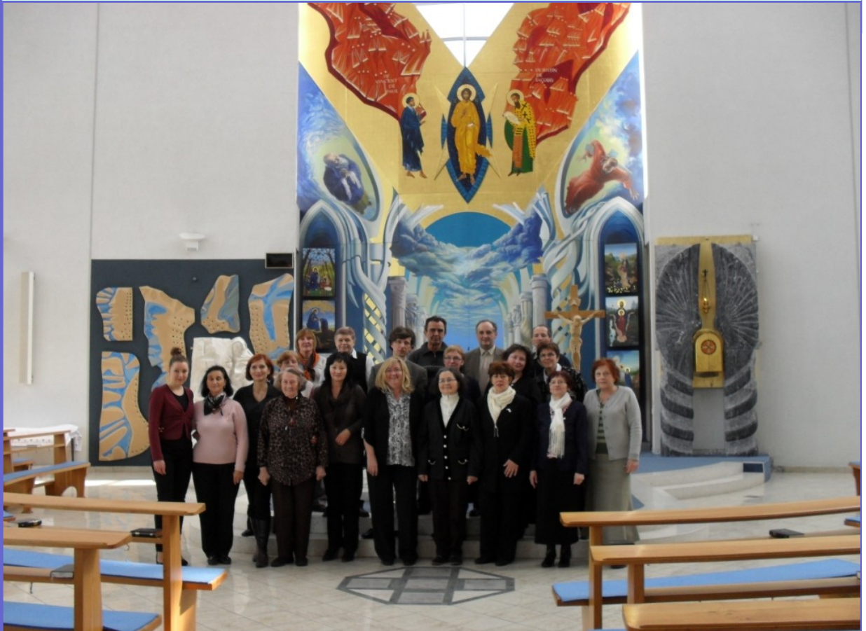
Medzinárodné stretnutie EUROPA 2 — Bratislava, Dom nádeje, 13.—16. marec 2013