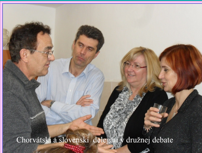
Chorvátski a slovenskí delegáti v družnej debáte

Spolok sv. Vincenta de Paul na Slovensku je zapojený v rámci medzinárodnej spolupráci so Spolkami celého sveta. Zúčastňuje sa pomoci pri humanitárnej výpomoci